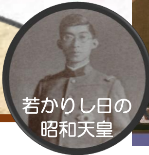
若かりし日の 昭和天皇