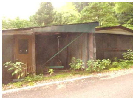
ガレージ(要補強・修繕)