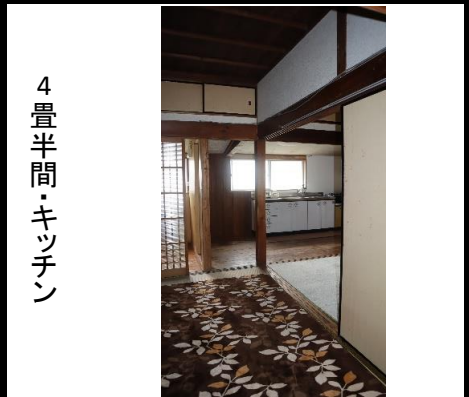
4畳半間・キッチン