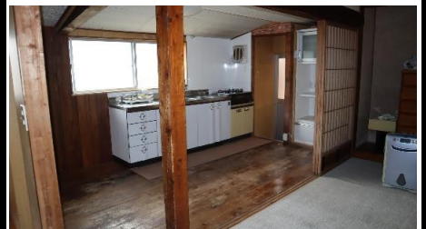
6畳間からキッチン