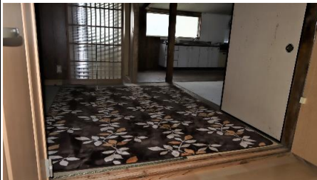
4畳半間・キッチン