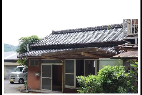
南東から(カーポート)