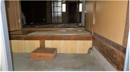
玄関から4畳半間・キッチン