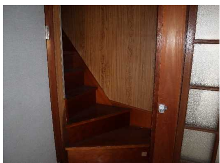
天井裏収納への階段