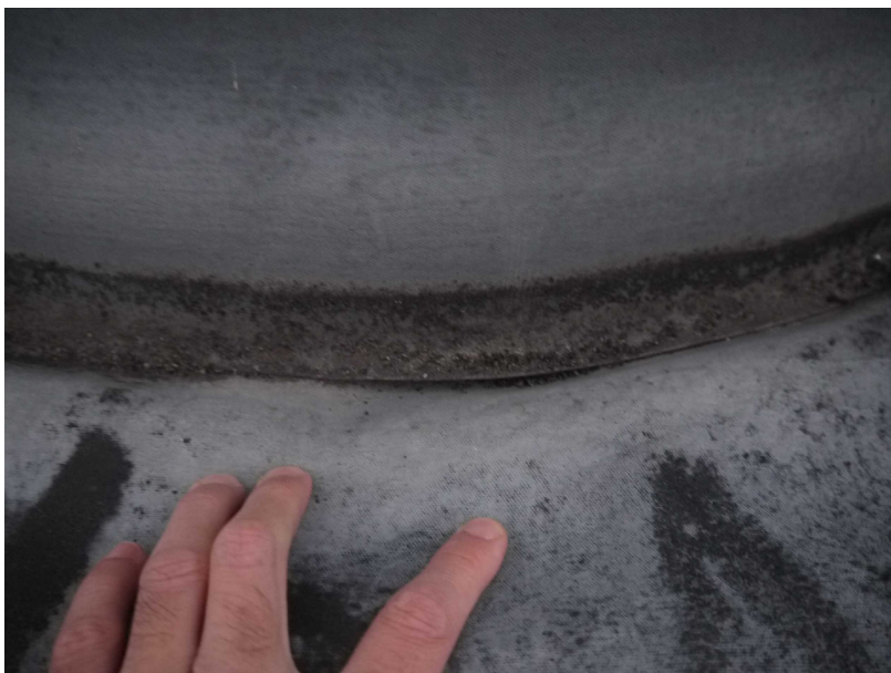
24マンホール周辺劣化状況