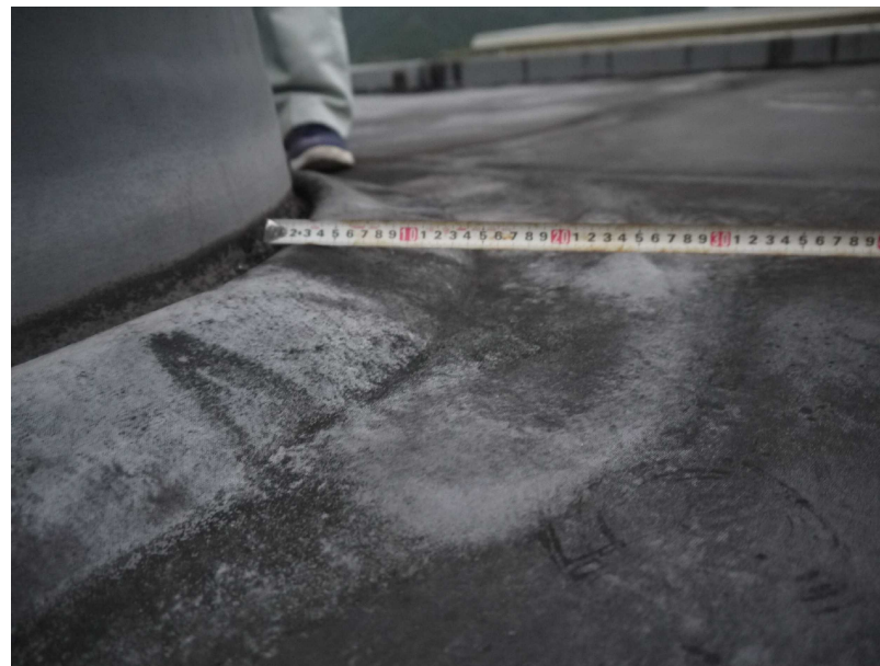
23マンホール周辺劣化状況