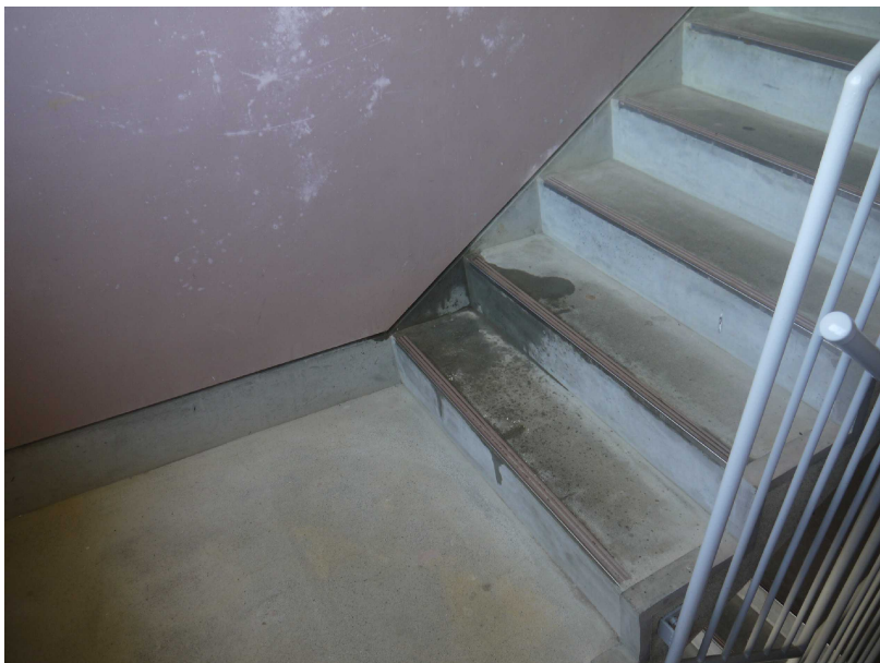
32降雨後の階段室雨漏り状況_階段