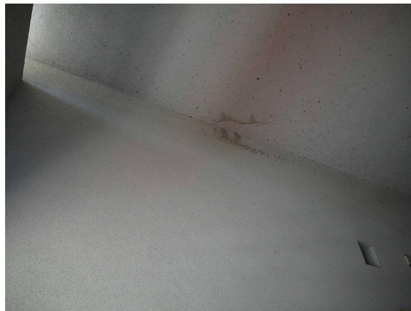
31降雨後の階段室雨漏り状況_天井