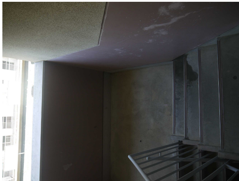
33降雨後の階段室雨漏り状況_階段